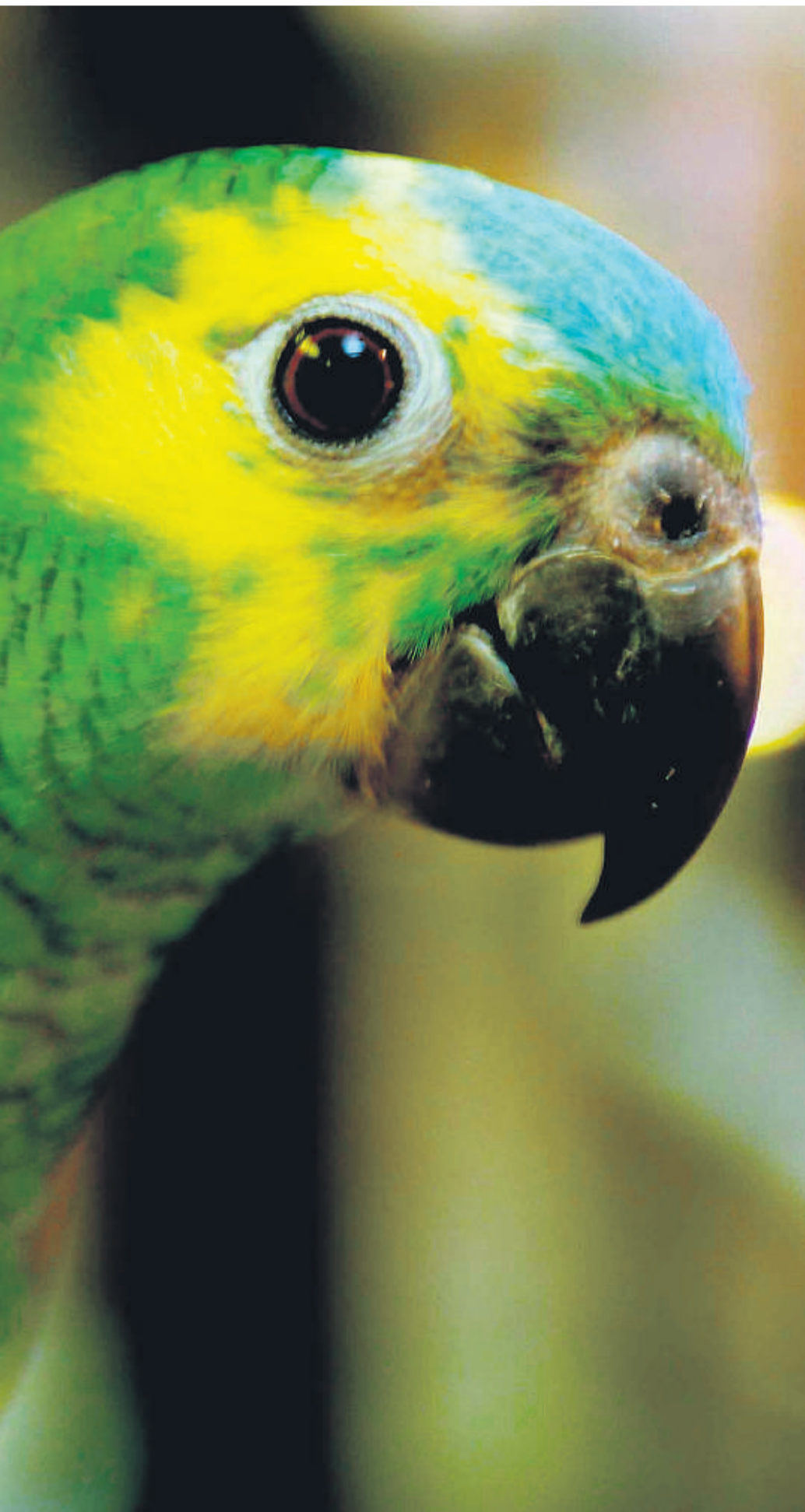
være vanskelig å se om fugler er syke.