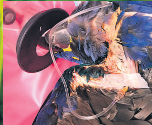
INTRAVENØS: Fuglen får intravenøs behandling etter operasjonen.