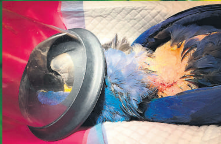
OVER: Hyasintaraens operasjon er over.