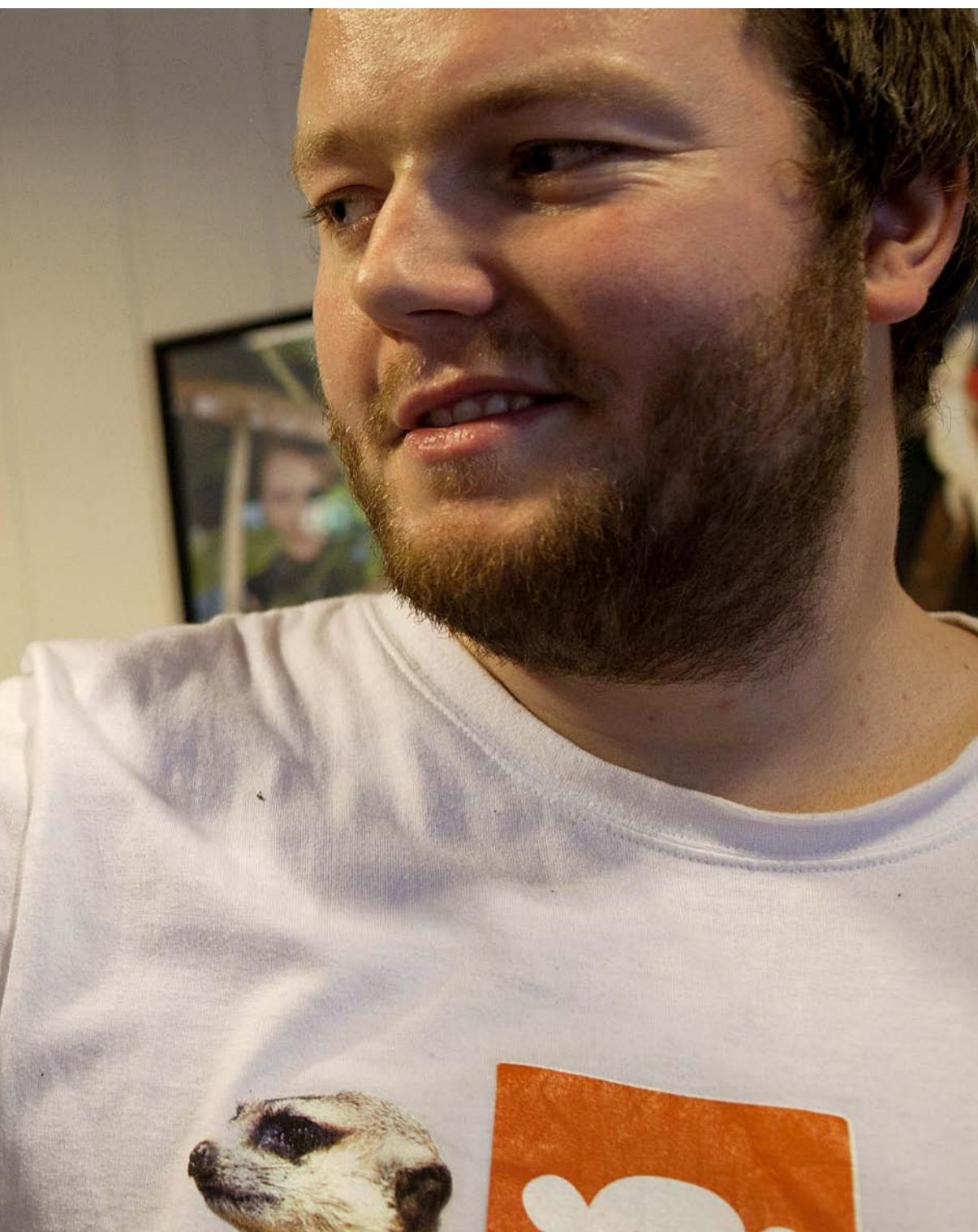
Nå har lovforslaget vært til behandling siden 2008.

Dyrevelferdsmessig mener han at de reptiler som er enkle å holde, kanskje er de dyrene som har det best i et godt tilpasset terrarium.