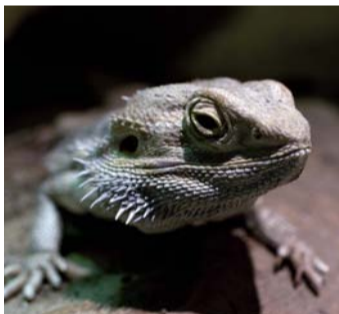
Skeggagam Pogona Vitticeps er det flotte navnet til denne øglen som kan bli kjæledyret ditt om Mattilsynet får gjennom sitt lovforslag.

Tekst: Birte Hegerlund Runde